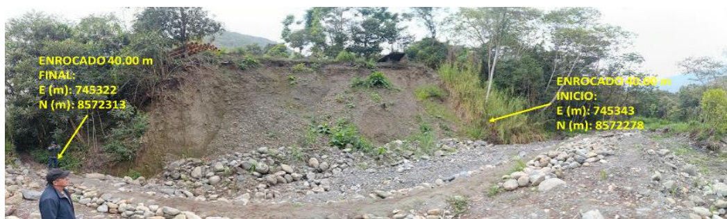
FIGURA N°01: TRAMO CRÍTICO EN LA QUEBRADA GARABITO EN EL DISTRITO DE SANTA ANA, PROVINCIA DE LA CONVENCIÓN Y DEPARTAMENTO DE CUSCO