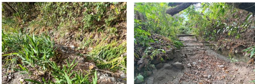
FIGURA N°02: AFECTACION A CANAL DE DERIVACION DE AGUA PARA EL RIEGO EN EL SECTOR DE POTRERO, HACIENDA POTRERO Y UNIVERSIDAD NACIONAL INTERCULTURAL QUILLABAMBA.