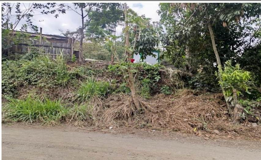
FIGURA N°03: VIVIENDA AFECTADA POR EL DESLIZAMIENTO DEL TALUD EN LA MARGEN DERECHA DE LA QUEBRADA GARABITO